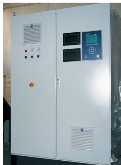
Рис. 1. Применение контроллера UNISAB III SABROE на агрегатах «Култек»